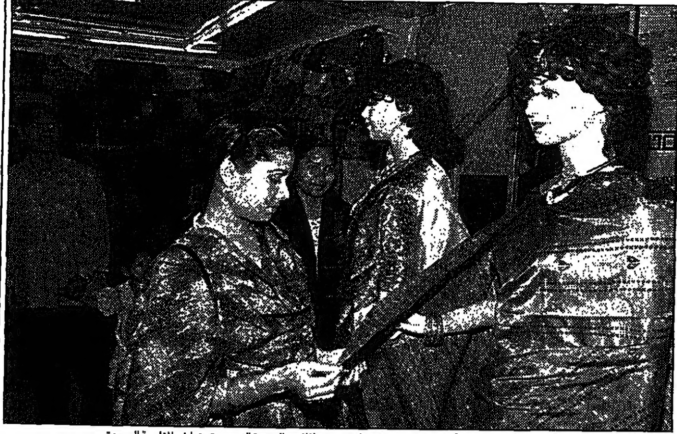
مع اقتراب عيد النحر المبارك بدأت النساء في اسواق مكة البحث عن الملابس الجديدة التي سيرتديها في المناسبة السعيدة...